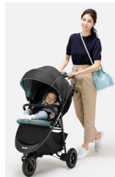
<LUXE RED リュクスレッド(RD)> <LUXE GREEN リュクスグリーン>