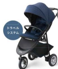
スムーヴ トラベルシステム ¥67,000 (税込 ¥72,360) ずやすやをそのままに、気軽におでかけ5WAYに使えるトラベルシステム搭載

※路面の状況や天候による影響でブレーキが性能を発揮しない場合があります。ご使用前に必ず取扱説明書をよく読み正しくお使いください。