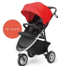
スムーヴ AC ¥59,000 (税込 ¥63,720) 操作性が良く、赤ちゃんのための機能もしっかり搭載

操作性がよく、赤ちゃんにとってもいい3輪ベビーカー『スムーヴ』は生後1か月から使えます