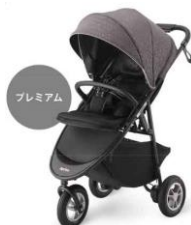
スムーヴ プレミアム ¥64,500 (税込 ¥69,660) こだわりのデザインとさらにプレミアムな機能を搭載