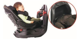
後向きシート ※リクライニング2段階