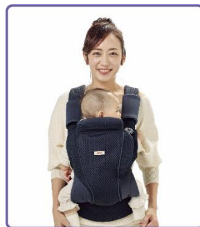
タテ対面抱っこ ※5※6 14日～36カ月