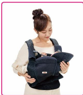
ママうで抱っこ ※4 0カ月～4カ月