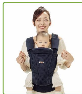
前向き抱っこ 7カ月～24カ月