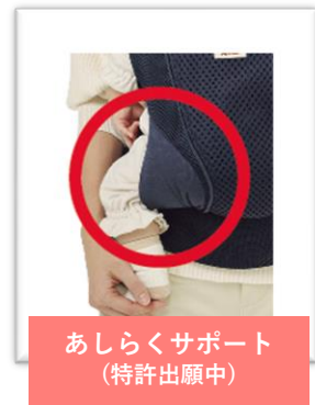
あしらくサポート (特許出願中)