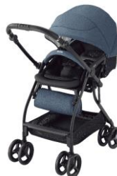
<RunRun Compact Be LIMITED ストライプネイビー NV>