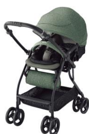
<RunRun Compact Be LIMITED アニマルカーキ GN>

ニューウェルブランズ・ジャパン合同会社（本社：東京都港区、ベビー事業部 最高責任者：前田英広）は、アップリカ×ベビーザラス コラボレーションモデルとなる【Be LIMITED】シリーズより、新たに「RunRun Compact(ルンルン コンパクト)」を2021年4月下旬から全国のトイザラス、ベビーザラス店舗 ※2 、「トイザラス・ベビーザラス オンラインストア」(www.babiesrus.co.jp)で発売します。