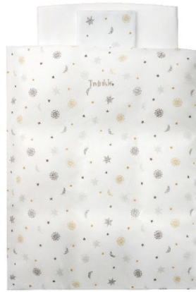
Twinkle (BL) トゥインクル レギュラーサイズ/ミニサイズ