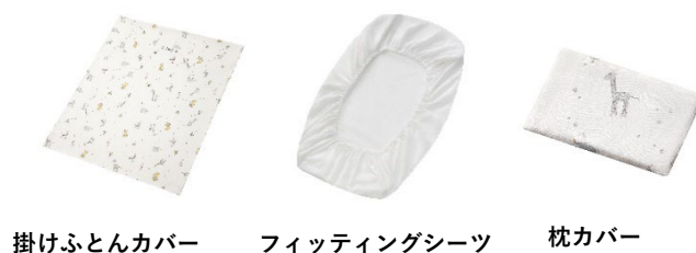
掛けふとんカバー フィッティングシート 枕カバー