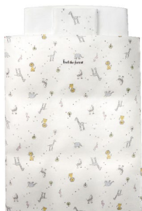
Feel the forest (WH) フィール ザ フォレスト レギュラーサイズ/ミニサイズ